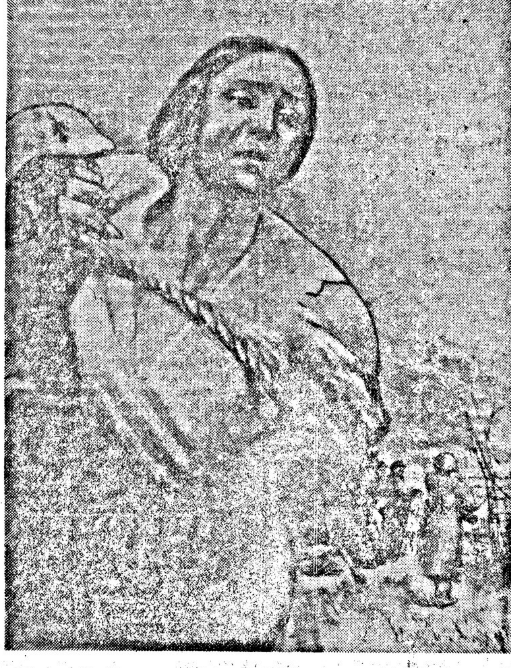
Плакат М. Мальцева. Издательство «Искусство»