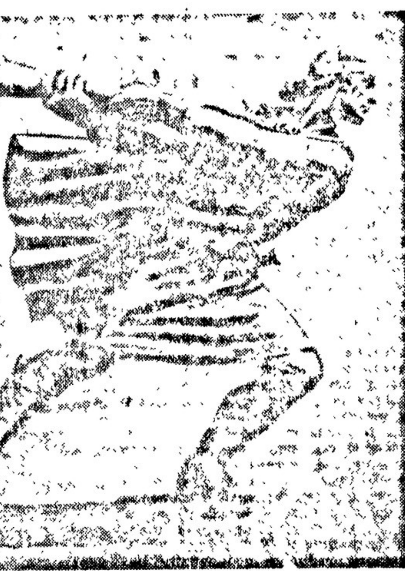
«Эстонский повстанец» Скульптура Ф. ОАИНАМБРО, Выставлена работ историком художником.